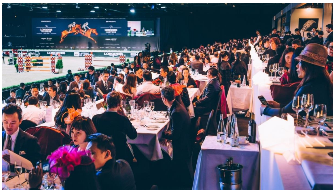
Longines Masters de Hong Kong (Février 2016)

EEM continue ainsi de tisser, au fil de ses voyages et de ses rencontres aux quatre coins du monde, des liens solides et durables avec chacun des acteurs et bâtisseurs de ses événements, toujours réunis autour de leur passion commune pour les sports équestres mais aussi leur envie de partager de nouvelles découvertes et de nouvelles cultures par-delà le monde.